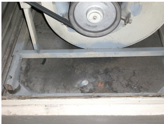
Foto 7 Gebrek: verval op centrale toevoerventilator, omvang 20% (=vervangingswaarde t.o.v. geheel)