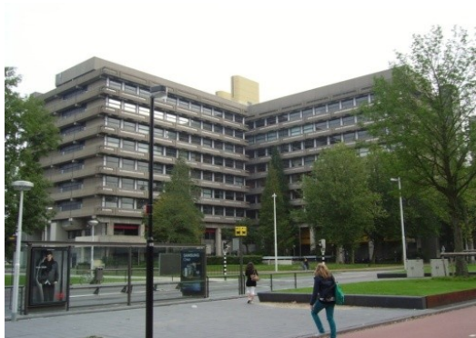
Foto 3 Kantoorgebouw, elementnr. 471110 dakafwerking bitumen, 100 m 2