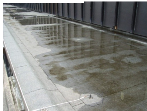
Foto 2 Gebrek: onvoldoende afschot en lichte aanslag/vervuiling, omvang 75%