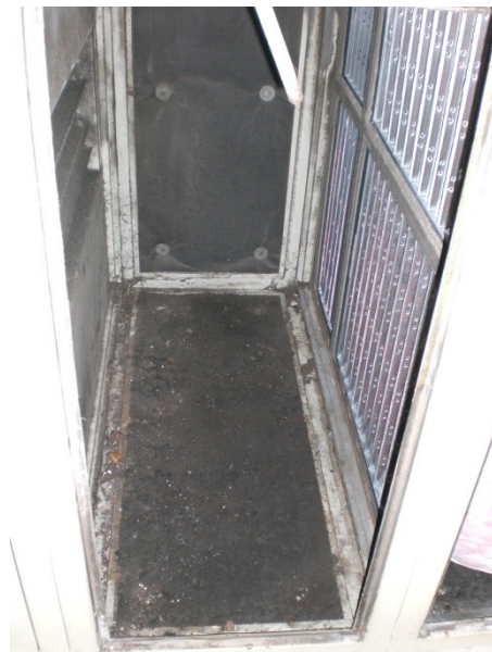
Foto 5 Gebrek: corrosie, gevorderd stadium, omvang 6% (=vervangingswaarde t.o.v. geheel) en beschadigde isolatie, eindstadium, omvang 6% (=vervangingswaarde t.o.v. geheel)