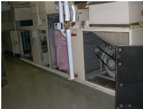
Foto 6 Elementnr. 577140 1 st. Luchtbehandelingskast.

Gebruik hiervoor bijgevoegd invulformulier en ga hierbij uit van onderstaande omvangbepaling. (omvang betreft het aandeel van de vervangingswaarde t.o.v. de totaalwaarde van het element)